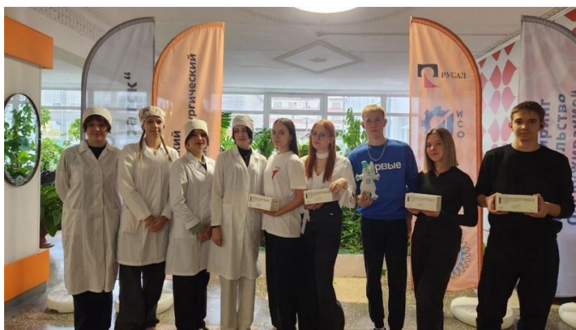
Участники движения первых на эстафете благодарности «От первички первичке».

С 2023 года в колледже открыто первичное отделение Движение первых. За период его существования актив стал призерами совместного проекта российского сотрудничества колледжа и движения первых Толковый спикер. Студенты участвуют в региональных школах актива и различных всероссийских проектах. Не одно городское мероприятие не обходится без активистов Братского медицинского колледжа.