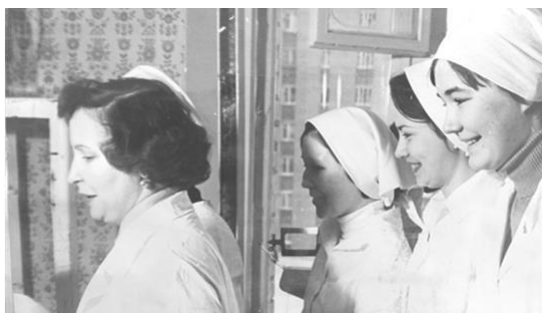
На практическом занятии по общему уходу, 1982 г.

Медицинских сестер начали готовить с 1976 г.