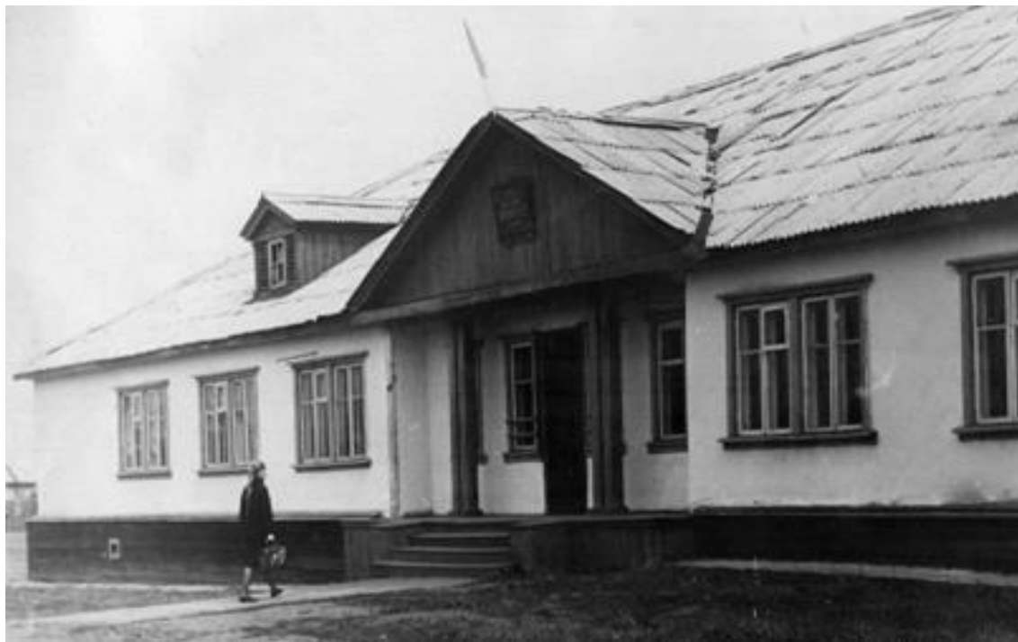
Первое здание училища, п. Осиновка, ул. Некрасова 4

Занятия проводились в здании профтехучилища, а затем, училищу были выделены 3 комнаты МСЧ №2. В учебных классах не было оборудования и наглядных пособий.