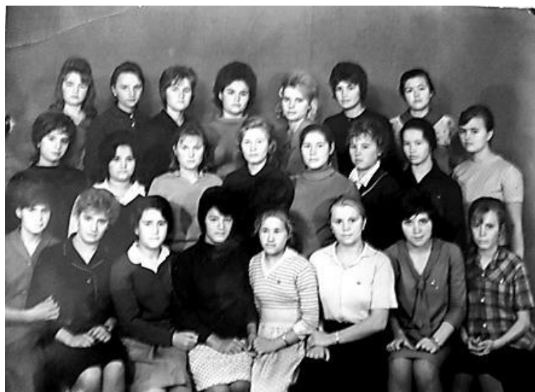
Первый набор акушерок, 1965 г.

С каждым годом количество учащихся возрастает. К началу 70-х было выпущено 255 фельдшера и 29 акушерок.