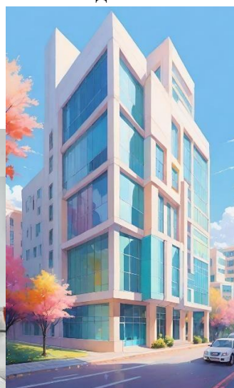
Разработчик протезов и имплантов.