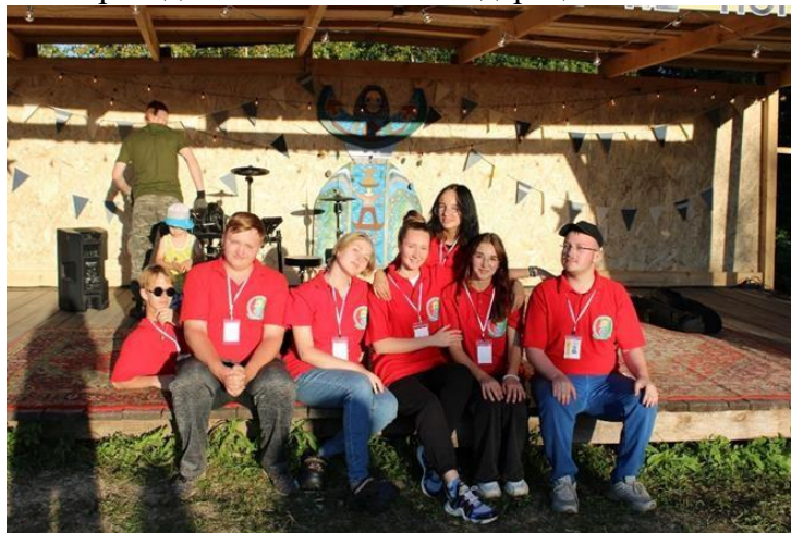
Волонтеры-медики на арт-фестивали «Дубыне».

На базе колледжа с 2018года работает местный штаб ВОД «волонтеры-медики». Они проводят и участвуют в профилактических мероприятиях и просветительных акциях. А за участие во всероссийской акции Мы вместе 6 активистов были награждены медалью Президента Российской Федерации.