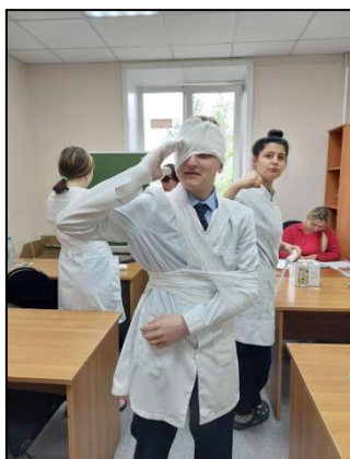
Рисунок 1 – Наложение повязок

После преодоления препятствий, я без проблем поступил в техникум. Поначалу было некомфортно находиться на новом месте, среди пока еще незнакомых тебе людей, но я быстро адаптировался. Мне повезло с группой, так как мои сверстники были более сплочённые по сравнению со школьными. Учителя здесь во многом отличаются от школьных, они дружелюбные, хорошо знают и преподают свой предмет.