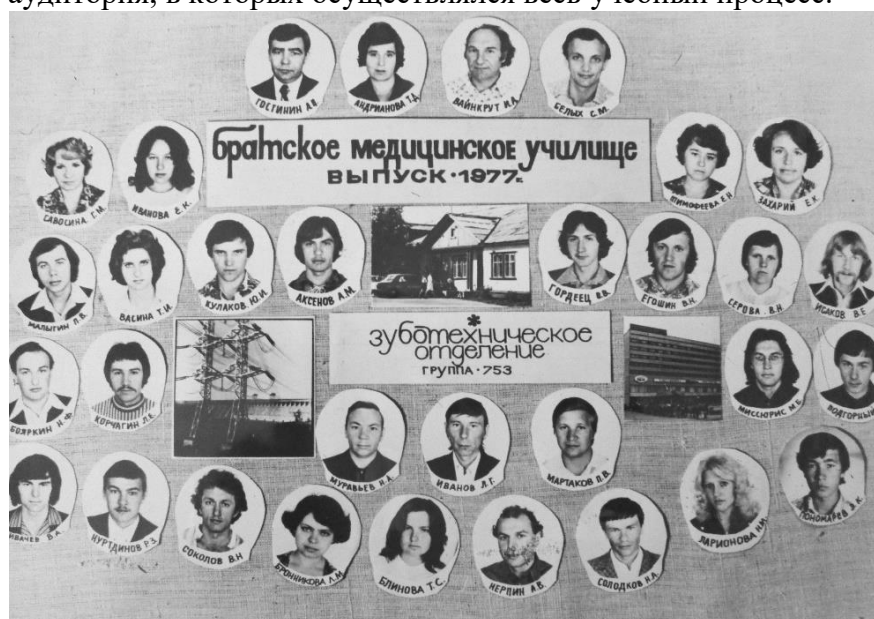
Выпуск зуботехнического отделения 1977года.

В 1970 году открывается зуботехническое отделение. Были выделены 2 практикума и 1 аудитория, в которых осуществлялся весь учебный процесс.