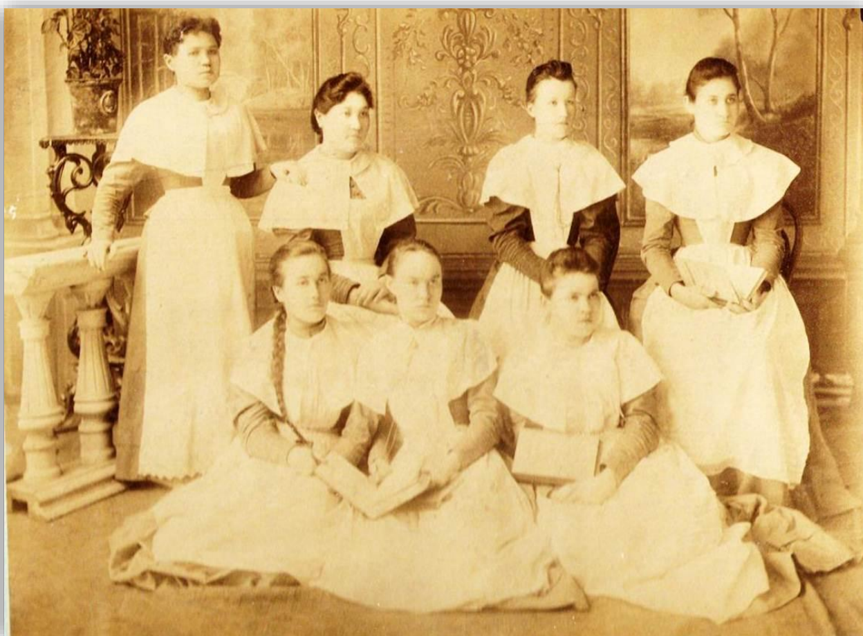
Рис.3 – Первый выпуск центральной для Восточной Сибири школы фельдшерниц, 1897 год