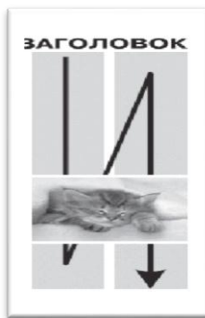
Рис.2 – Размещение заголовка и текста статьи

- В конце статьи заглавными буквами сведения об авторе: Ф.И.О. автора, должность, полное название учреждения.