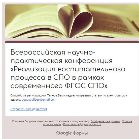
Рис.2 Подтверждение регистрации

Спасибо за проявленный интерес! Благодарим за участие!